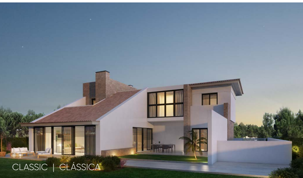
CLASSIC | CLÁSSICA