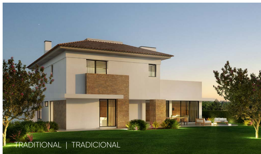
TRADITIONAL | TRADICIONAL

The 86 villas are located on the outskirts of the residential area and are available with 4 bedrooms. There are 4 different architectural designs for the villas, which are inserted in plots of different sizes, all overlooking the pine forest, golf course and the lake.