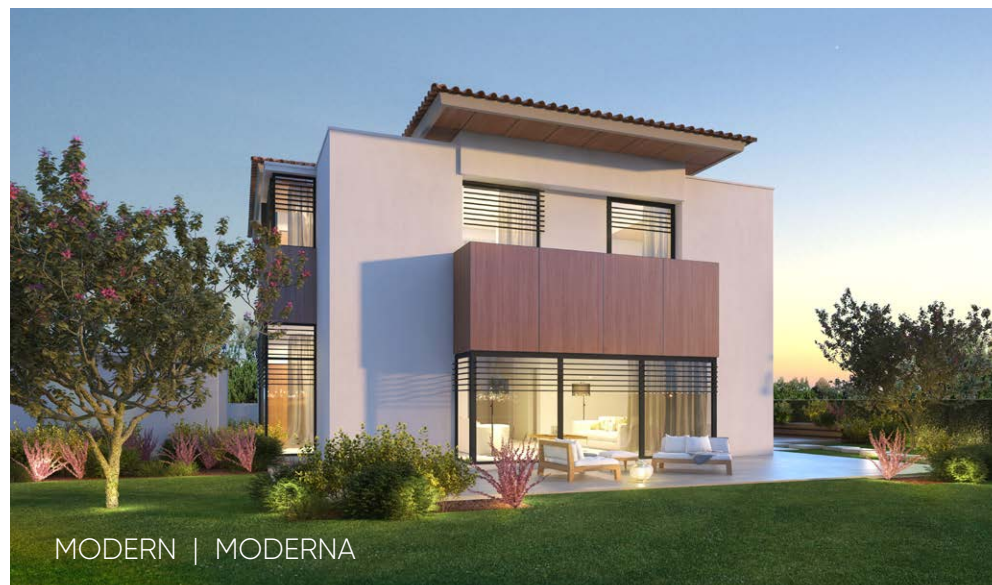
MODERN | MODERNA