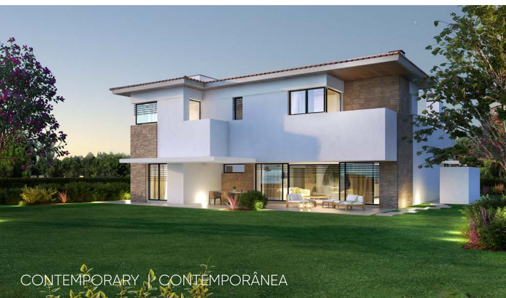
CONTEMPORARY | CONTEMPORÂNEA